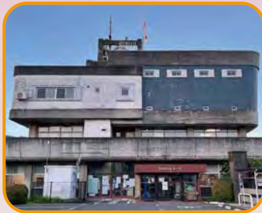
第一庁舎

昭和 37 年に建設された湯河原町役場第 1 庁舎、建設から 60 年経過しております。昭和 55 年に建設された第 2 庁舎と旧耐震基準で建設された庁舎は大地震が発生した場合、災害拠点機能として機能できるのだろうか？湯河原庁舎のあり方検討基礎調査業務委託の業務報告書（概要版）が公表されました。その資料よりデータを抜粋しております。